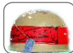
وصایای شهدای تعلیم و تربیت ***۵