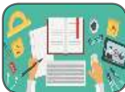
معلم فکور در بستر فضای مجازی ***۹