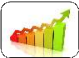
آمار فارغ التحصیلان پردیس ***۷