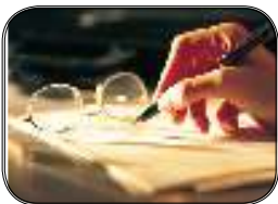
سخن سردبیر ***۴