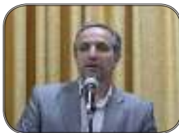
سخن ریاست پردیس ***۳