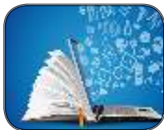
اقدامات دانشگاه در عصر کرونا ***۶