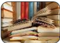
برگی از یک کتاب ***۱۱