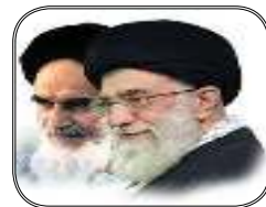
سخن امام و رهبری **۳