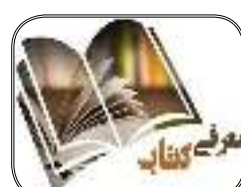
معرفی کتاب ***۸